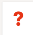
n° 3 Format 17 x 15 cm 50 € prix public 65 €